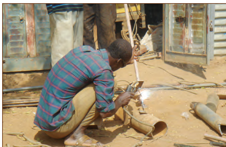
Fabrication d'Outils de Forage

En raison du caractère de renforcement des capacités de ce programme, il sera important pour l'état et les bureaux d'étude d'assurer un rôle d'encadrement plutôt qu'un rôle strict de réglementation. Quand ils constatent une insuffisance sur le terrain, ils devraient expliquer ce qui a été mal fait, comment cela devait se faire et pourquoi. L'objectif est de créer un secteur professionnel du forage manuel qui réalise des forages de haute qualité et qui comprenne pourquoi les bonnes pratiques doivent être observées.