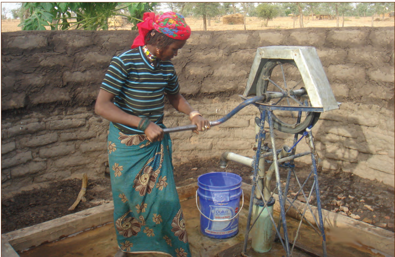
Pompe à Corde montée sur un Puits Foré à la Main

L'annexe 2 contient une liste de vérification qui aidera à la mise en œuvre du programme de forage manuel. La liste devra être adaptée aux besoins de chaque pays mais ne devrait pas remplacer l'assistance d'experts qui ont exécuté des programmes similaires dans d'autres pays.