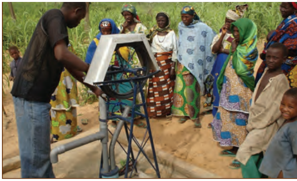
Formation sur les Pompes à Corde

leur capacité. Une fois que les entreprises sont sélectionnées, il conduira une évaluation des besoins en formation. En utilisant le manuel de formation des entreprises professionnelles de forage manuel comme guide, l'organisme préparera un programme de formation sur mesure pour répondre aux besoins des entreprises sélectionnées. Le manuel fournit des modules sur l'enregistrement des données, l'immatriculation, le calcul des coûts, les appels d'offres, la gestion du personnel, la relations avec les clients, les sources de financement et le marketing.