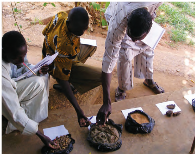
Formation en Hydrogéologie

aux besoins perceptibles qui empêchent actuellement les entreprises d'accéder à de marchés nouveaux ou plus grands. Les entreprises du secteur informel ne sont pas autorisées à soumissionner aux appels d'offres car elles ne sont pas en règle. Il sera important que la formation en gestion puisse aider les foreurs à se régulariser vis-à-vis de l'administration et à conserver un registre de gestion dont elles auront besoin pour répondre