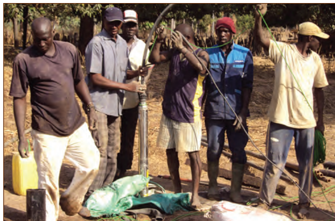
Formation des Foreurs à Ziguinchor

Il est probable que dans la plupart des pays, qu'il soit difficile de trouver des entreprises remplissant l'ensemble de ces critères, mais s'il y a assez d'entreprises remplissant la plupart d'entre eux, le programme de renforcement des capacités pourra être conçu de façon à combler le fossé.