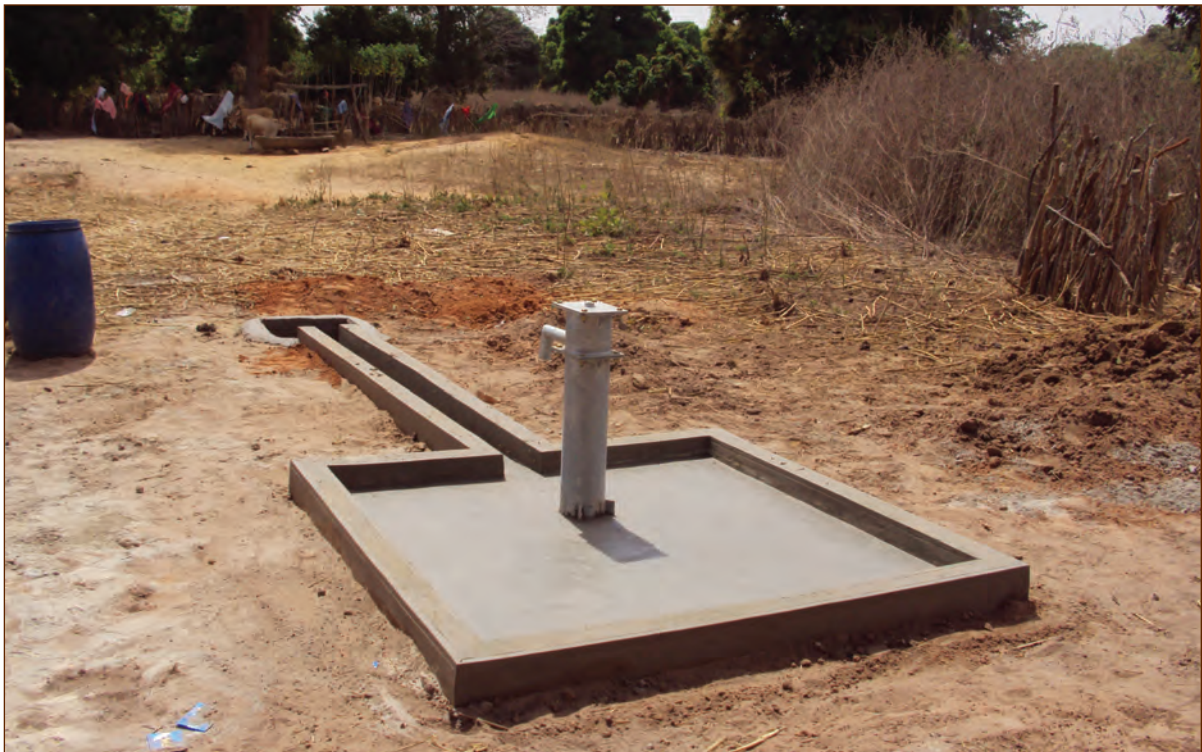
Seuil en Béton et Puits Foré à la Main