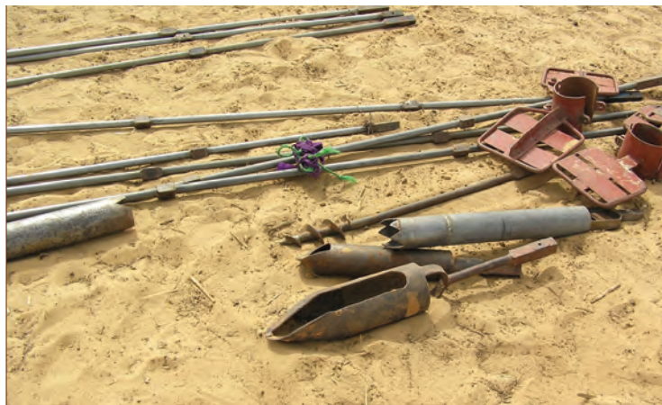
Outils de Forage

La réaction du gouvernement dépendra en grande partie de l'expérience du pays par rapport au forage manuel. S'il y a eu par le passé des expériences de forages de mauvaise qualité et de pollution de l'aquifère, la nécessité de la professionnalisation du secteur devient évidente. Toutefois, le gouvernement voudra bien être rassuré qu'un mécanisme de contrôle de qualité et de certification serait mis en place. Si le pays a une expérience très limitée des forages manuels, le